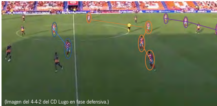
(Imagen del 4-4-2 del CD Lugo en fase defensiva.)

En fase defensiva, es un equipo camaleónico. Y es que es tan capaz de ejercer una presión en bloque alto como de replegarse en bloque bajo. Por ello, a la hora de valorar al CD Lugo en defensa, hay que tener muy en cuenta el contexto y las fases por las que pasa el partido. Sin embargo, lo que no cambia es el dibujo. El 1-4-2-3-1/1-4-4-2 es inamovible cuando el cuadro gallego no tiene el control del esférico.