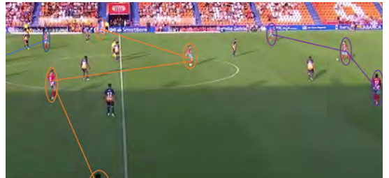
(Imagen del 1-3-4-3 del CD Lugo en salida de balón.)