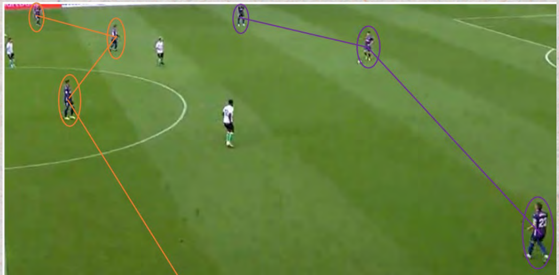
((Imagen del 1-3-4-3 en salida de balón))

En fase ofensiva, el conjunto armero se está caracterizando por ser un equipo que muestra una clara predisposición por sacar el balón jugado desde atrás. Para facilitar eso, en ocasiones, Sergio Álvarez se incrusta entre los centrales, dando paso a que los laterales ganen altura amplitud y el dibujo inicial cambie a un 1-3-4-3.