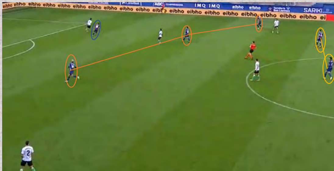
(Imagen del 1-4-2-3-1 de la SD Eibar en fase defensiva)

En fase defensiva, la SD Eibar mantiene ese 1-4-2-3-1. Sin embargo, los vascos suelen ejercer una alta presión sobre el rival para dificultar su salida de balón. Pese a ello, la zaga armera se sitúa en bloque medio para evitar problemas con posibles balones en largo contrarios.