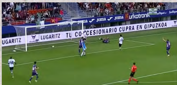
(Secuencia del gol de Stoichkov ante el Racing de Santander)

En fase defensiva, la SD Eibar mantiene ese 1-4-2-3-1. Sin embargo, los vascos suelen ejercer una alta presión sobre el rival para dificultar su salida de balón. Pese a ello, la zaga armera se sitúa en bloque medio para evitar problemas con posibles balones en largo contrarios.