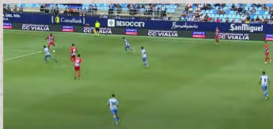
(Imagen de la presión alta del Málaga)

En fase defensiva, se trata de un equipo que suele exigir mucho a su rival en salida de balón. Normalmente, apuesta por ejercer una presión alta con la línea defensiva en bloque medio para tratar de reducir el máximo espacio posible y hacer que su contrincante pierda rápidamente la posesión de balón. Pese a ello, cabe recalcar que no está logrando ser fiable atrás, algo que refleja la cantidad de goles encajados en este curso (21), convirtiendo, así, en el tercer conjunto más goleado de la categoría de plata.