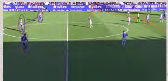
(Imagen del 1-3-4-3 en salida de balón)

Tras la dimisión de José Gomes, la SD Ponferradina rastreó el mercado buscando a un técnico libre que, además de compartir la misma filosofía futbolística que el portugués, aportara resultados. En ese momento, Tomás Nistal llamó a la puerta de David Gallego. El entrenador catalán llevaba poco menos de un año sin entrenar tras caer cesado en su última aventura en Gijón. Con el objetivo de relanzar su propia carrera y la trayectoria del conjunto berciano en Liga, el ex del RCD Espanyol aceptó el reto. Por el momento, un balance de dos victorias, dos empates y cuatro derrotas no es capaz de revertir la difícil situación que vive el cuadro blanquiazul. Y es que, a falta de jugarse este último choque de la jornada, la SD Ponferradina está en zona de descenso, algo que quiere cambiar David Gallego ganando en La Romareda.