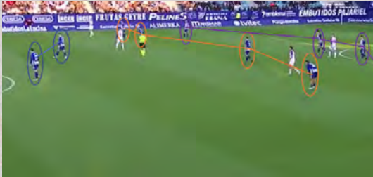
(Imagen del 1-4-4-2 de la Ponferradina)