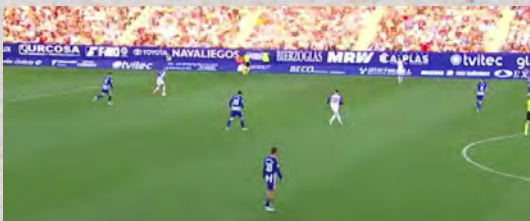
(Imagen de la presión de la SD Ponferradina en fase defensiva)

En fase defensiva, la SD Ponferradina trata de exigir lo máximo posible a su rival en salida de balón, alternando la presión con el repliegue en las distintas fases del partido. Pese a ello, la estructura del 1-4-4-2 se mantiene en defensa, algo que ha cambiado con la llegada de David Gallego. Y es que, antes, en ocasiones, el conjunto berciano apostaba por un 1-4-1-4-1 cuando no tenía el balón, haciendo que uno de sus puntos pasase al medio momentáneamente.